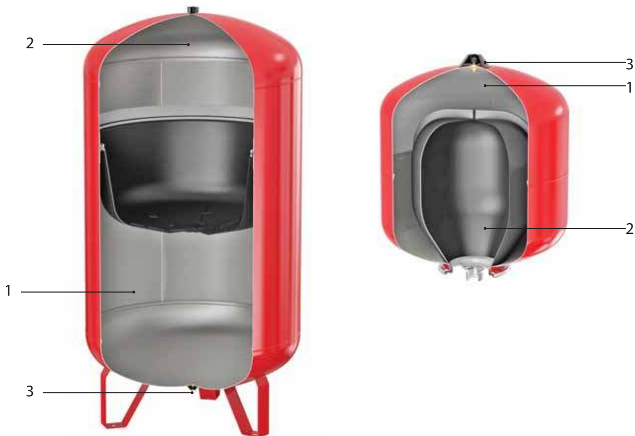
Рис. 1 Мембранные расширительные баки «Гранлевел»

Теплоносителем может служить этиленгликолевая смесь с концентрацией не более 50 %.